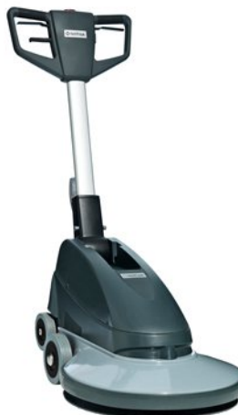
A kép illusztrációként szolgál.

A BU500 polírozó egy 1500 l/min. fordulatú, szíjhajtásos gép. A fémkeret, a nagy kerekek és ütközők, a fényes felület, összeolvasztva a modern dizájnnal robusztusságról, tartósságról és egyszerű tisztításról adnak tanúbizonyosságot. A biztonsági nyomógomb, az azonnali lekapcsoló, és a jól látható kábel a BU500-at a biztonság magas fokára helyezi.